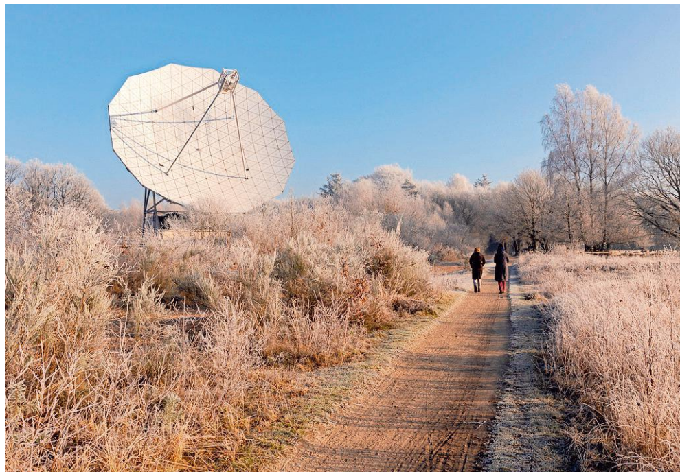
De Radiotelescoop bij Dwingeloo.

Restaurant Grenzeloos en Zo, 10.30-15.30: Wandelpool Het Doldersummerveld , wandeltocht Stichting De Mooiste Routes, opg. mooisteroutes.nl/wandelpools/.