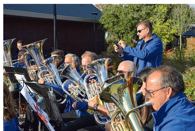
Apollo de Wijk mag weer naar binnen Artizzl Media

De blokfluiters, het opstaporkest en het jeugdorkest geven acte de présence. Het harmonieorkest kon lange tijd nog niet gezamenlijk repeteren. Het orkest heeft voornamelijk in twee delen gerepeteerd en daarom zullen de houtsectie en de koper- en slagwerksectie ook hun eigen repertoire ten gehore brengen. Het is uitzonderlijk dat bij een concert van Apollo de hout-